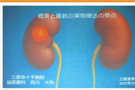
腎癌の治療戦略と地域医療連携